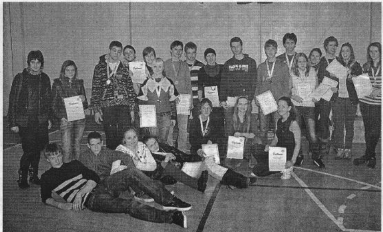
Šiaulių jaunųjų turistų centro jaunių ir jaunučių komandos ir Jelgavos mokiniai – turizmo technikos varžybų uždaroje patalpoje „Šiauliai-2010” nugalėtojai ir prizininkai.